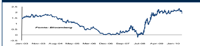
GER: Bund spread 2-10 anni