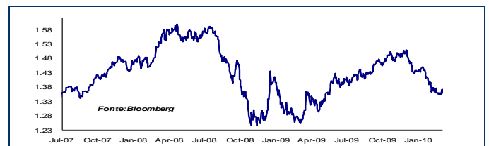
Tasso di cambio Eur/Usd

sottoscrizioni per circa la metà del totale offerto da parte delle banche centrali estere. Evans, membro non votante della Fed, si è spinto a dichiarare che la Fed potrebbe mantenere i tassi su livelli contenuti per almeno i prossimi 3-4 meeting, ossia in sostanza almeno fino ad agosto, aggiungendo che l' exit strategy della banca centrale farà molto affidamento sulla movimentazione della remunerazione delle riserve in eccesso. Oggi è attesa l'emissione sul comparto decennale.